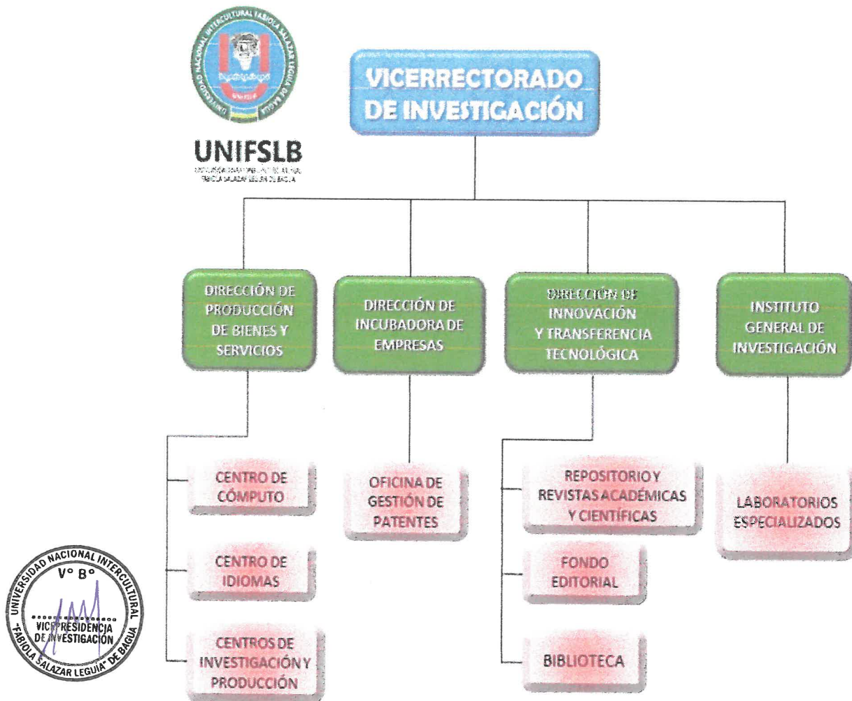
Figura 1. Organigrama del Vicerrectorado de Investigación